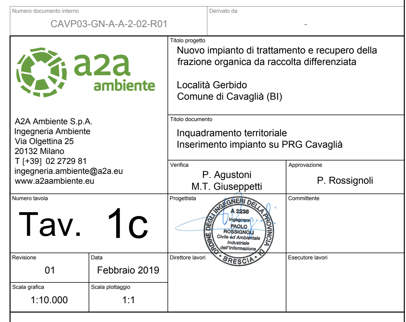
Sovrapposizione su PRG comune di Cavaglià