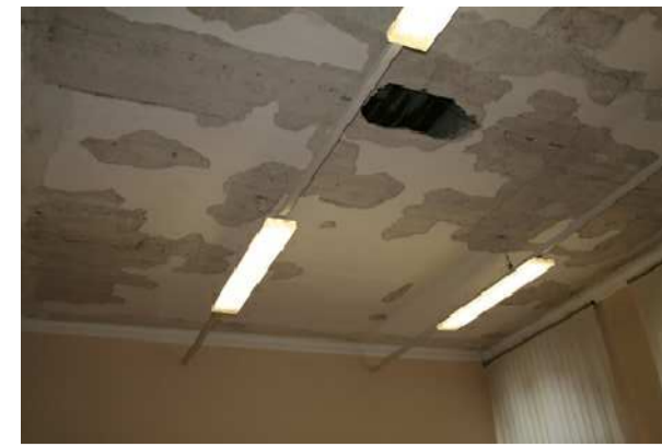
Foto 2 - particolare controsoffitto in CLS